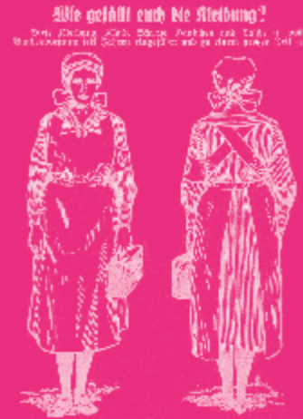
Bericht über Einführung einheitlicher Kleidung

Im Jahr 1927 führt der ASB Bundesvorstand eine einheitliche Schutzkleidung ein und befragt seine Mitglieder um ihre Meinung: „Das Kleid besteht aus einem blauweiß gestreiftem baumwollenen Waschstoff, hat eine sehr schlichte Form (...) Die Schürze von prima weißem Linon mit zwei Taschen, sowie das Häubchen mit unserem Bordenbesatz werden ebenfalls im Bunde hergestellt“, heißt es dazu anschaulich.